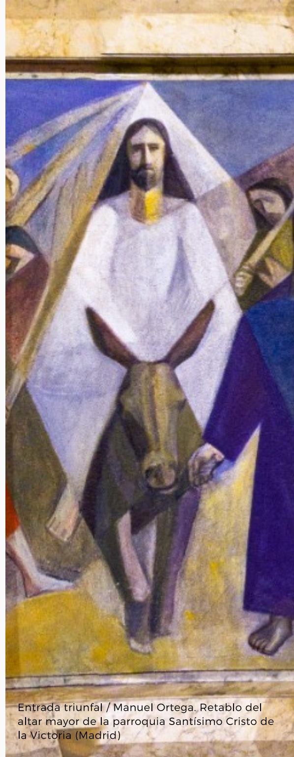
Entrada triunfal / Manuel Ortega, Retablo del altar mayor de la parroquia Santísimo Cristo de la Victoria (Madrid)

Envía a “dos de sus discípulos” a la “aldea de enfrente”, a buscar “un borrico”. Si hay algún contratiempo la respuesta que han de dar es que “el Señor lo necesita” . Jesús conoce los caminos del Padre y lo que la Escritura decía del Rey que había de entrar en Jerusalén: “alégrate, ciudad de Sión; aclama, Jerusalén; mira a tu Rey que está llegando: justo, victorioso, humilde, cabalgando un asno, una cría de borrica” (Zac 9,9).