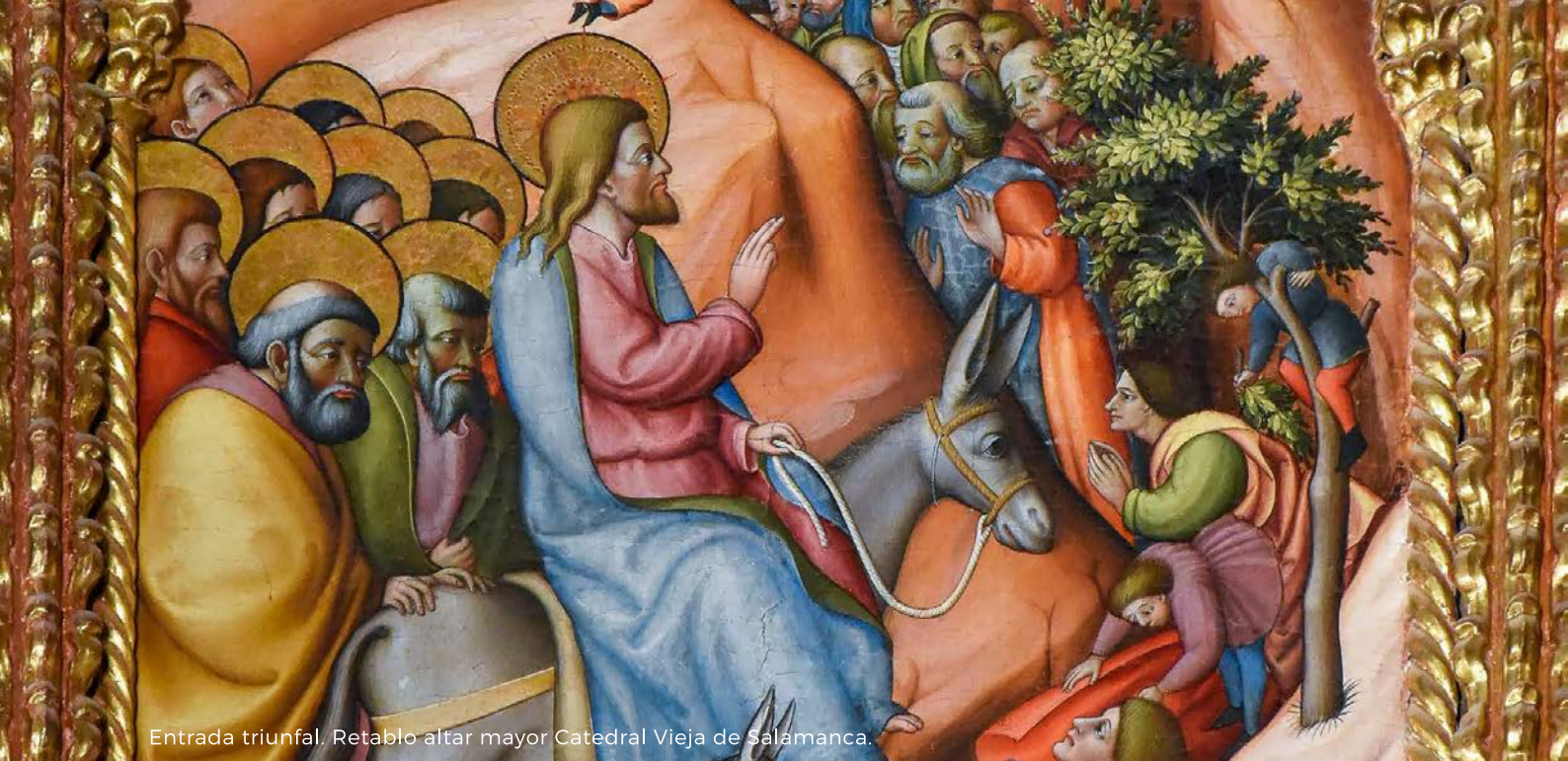
Entrada triunfal, Retablo altar mayor Catedral Vieja de Salamanca.